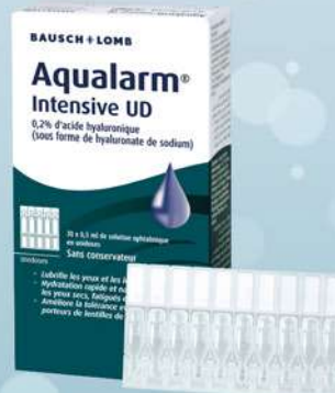
Format 30 Unidoses