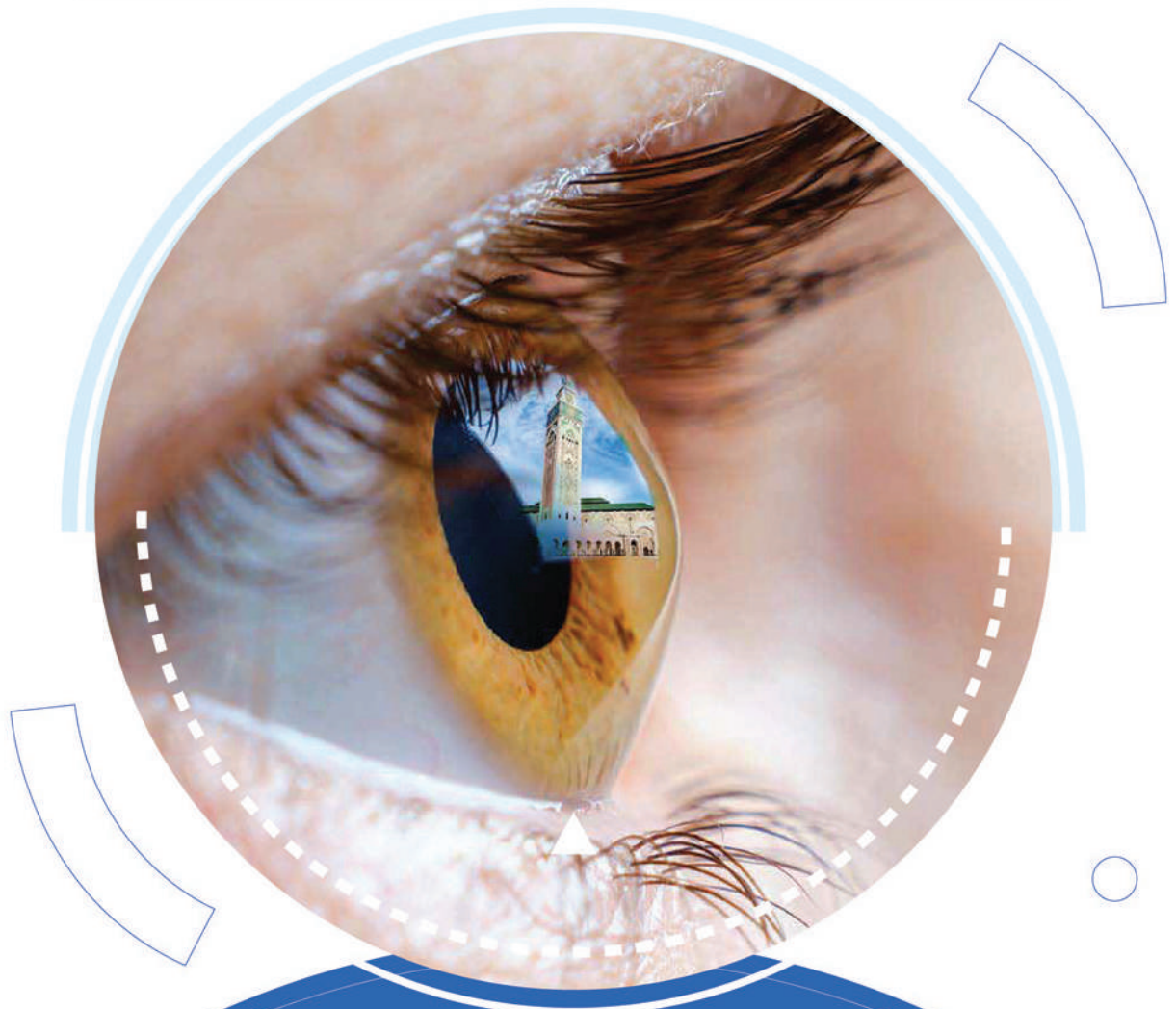
Table Ronde SMO/SMOC SO Imagerie de la surface oculaire