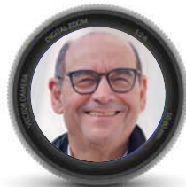
Pr. K. ZAGHLOUL