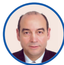
Pr K. ZAGHLOUL