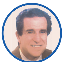
Feu Pr A. SEKKAT